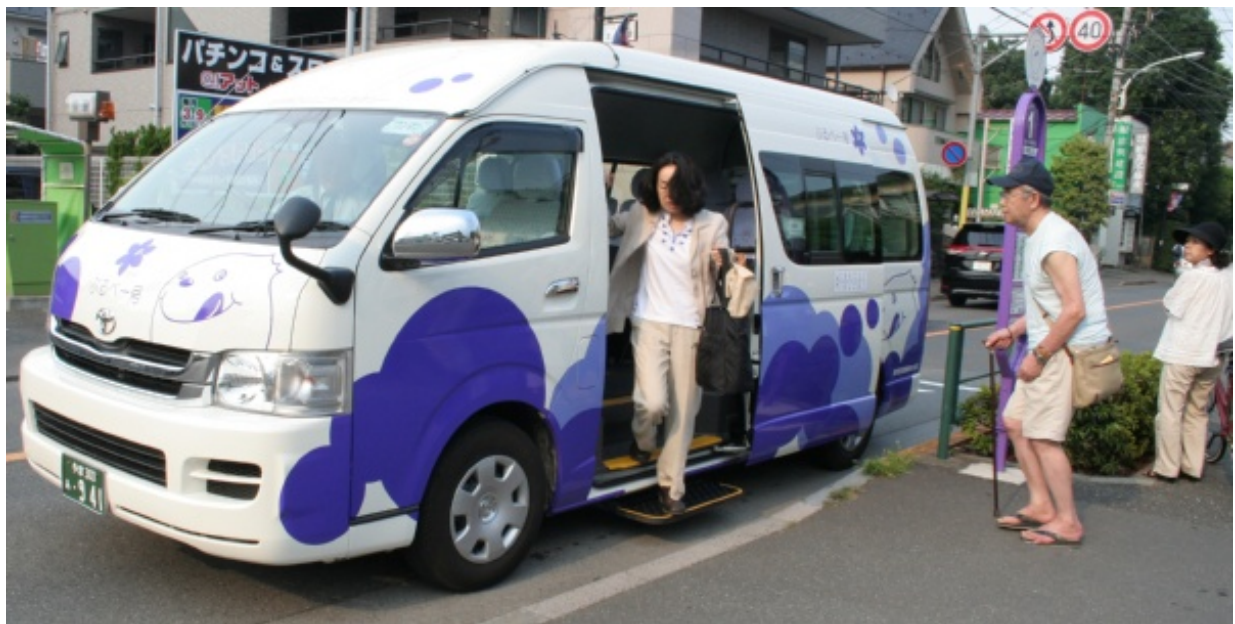
小平市コミュニティタクシー“ぶるべー号”（大沼ルート）

その後、現地の「小川・栄町コミュニティバスを走らせる会」渡辺代表や市のご担当者様（各調整中）も加え現地の方々にもご参加いただいて意見交換会を行います。